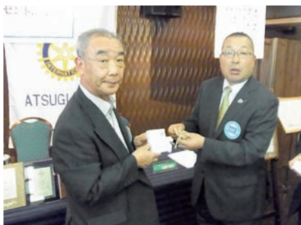
新旧会長バッチ交換