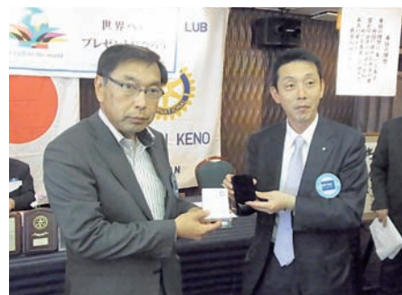
新旧幹事バッチ交換