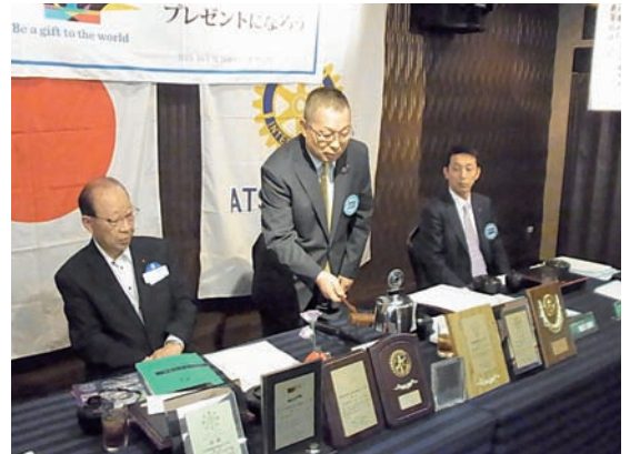
初めての点鐘に緊張気味の春日会長