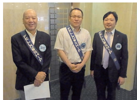
本年度お迎え隊のメンバー